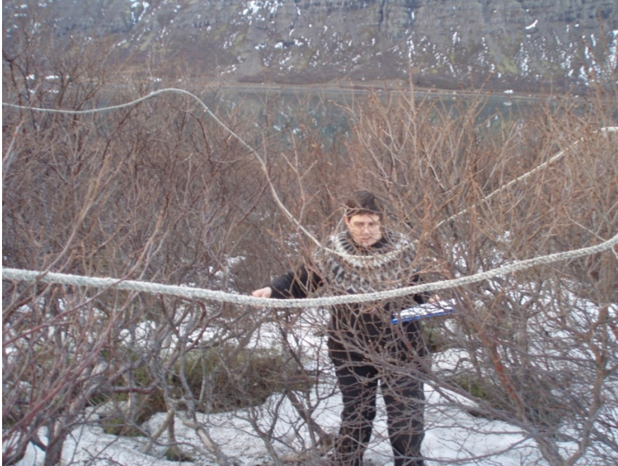
Mynd 6. Einn af rannsóknarreitum á svæði 4, birkikjarr yfir 2 m á hæð.

Rannsóknarsvæði 4 liggur meðfram núverandi vegi inn með Mjóafirði. Næst veginum er fremur hátt birkikjarr sem lækkar þegar nær dregur sjó. Kjarrið er á bilinu 70 - 200 cm að hæð. Lífmassi svæðisins reiknast á bilinu 3.654 - 30.058 kg/ha. Meðaltal 6 mælinga gefur lífmassa upp á 15.491 kg/ha. Birkivaxið svæði sem mun skerðast er 1,2 ha og er því lífmassi þess svæðis sem skerðist 18.589 kg þurrefnis.